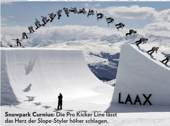
Snowpark Curnius: Die Pro Kicker Line lässt das Herz der Slope-Styler höher schlagen.