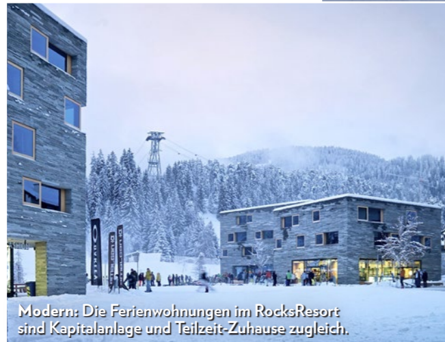
Modern: Die Ferienwohnungen im RocksResort sind Kapitalanlage und Teilzeit-Zuhause zugleich.